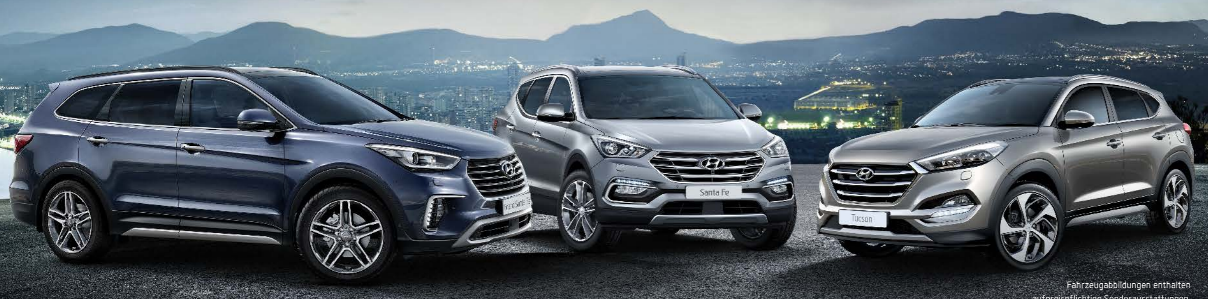
Fahrzeugabbildungen enthalten auf preispflichtige Sonderausstattungen.

Kraftstoffverbrauch innerorts 10,0 l/100 km, außerorts 6,2 l/100 km, kombiniert 7,6 l/100 km; CO 2 -Emission kombiniert: 177 g/km; Effizienzklasse D.